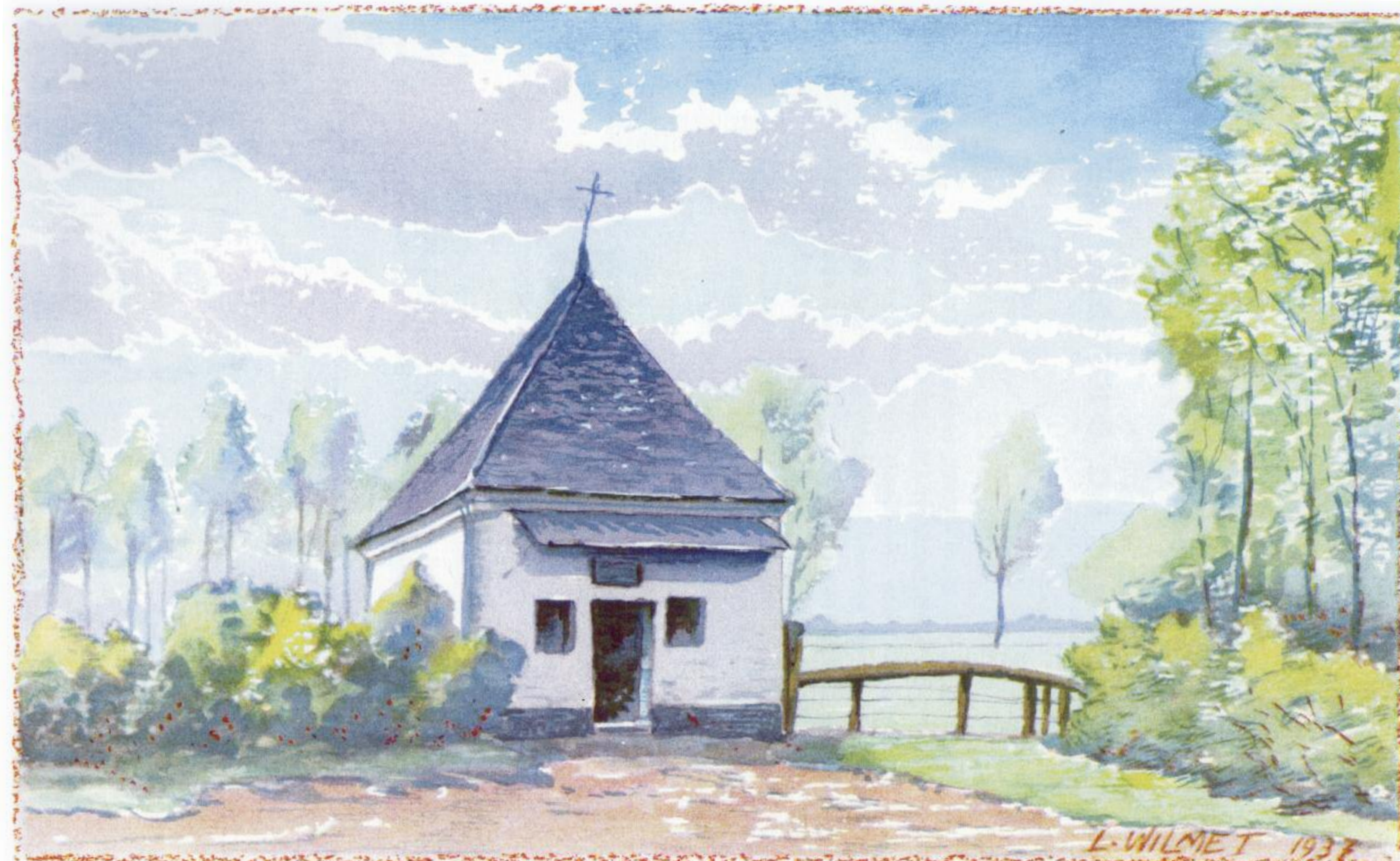
Illustratie L. Wilmet, 1937