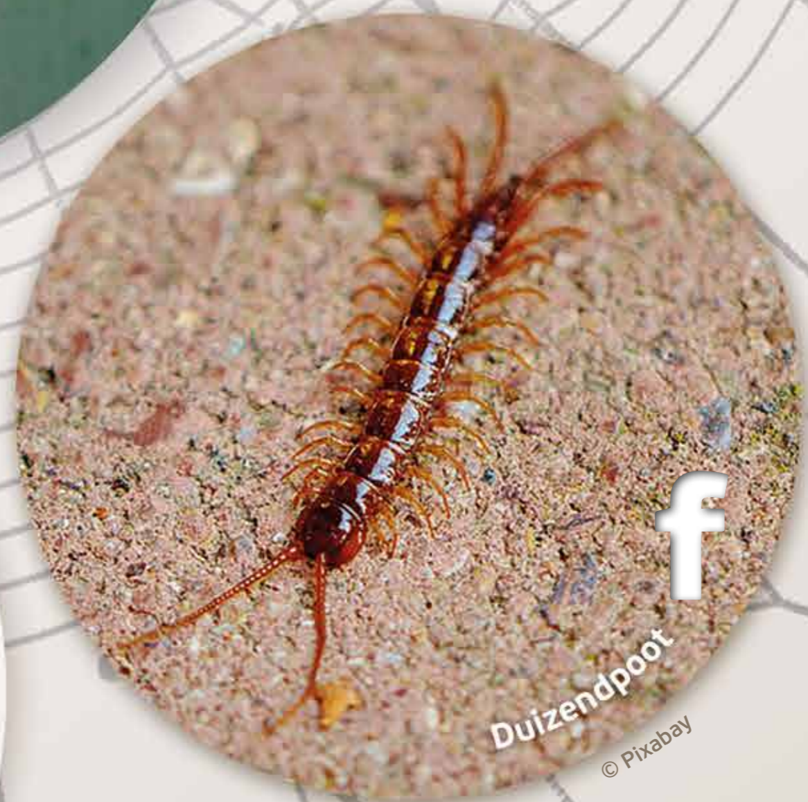
f Duizendpoot

Mijn naam doet me alle eer aan. Vroeger dachten de mensen dat ik kon helpen tegen bedplassen.