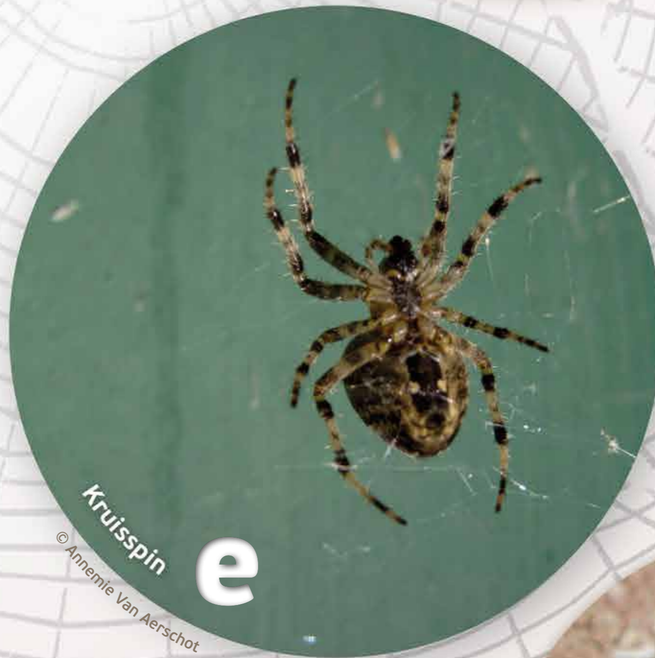
e Kruisspin

Ik ben het nachtdier van de kriebeldiertjes. Als het donker is, kom ik uit mijn schuilplaats en ga ik jagen. Maar wees gerust, in je oor kruip ik niet hoor.