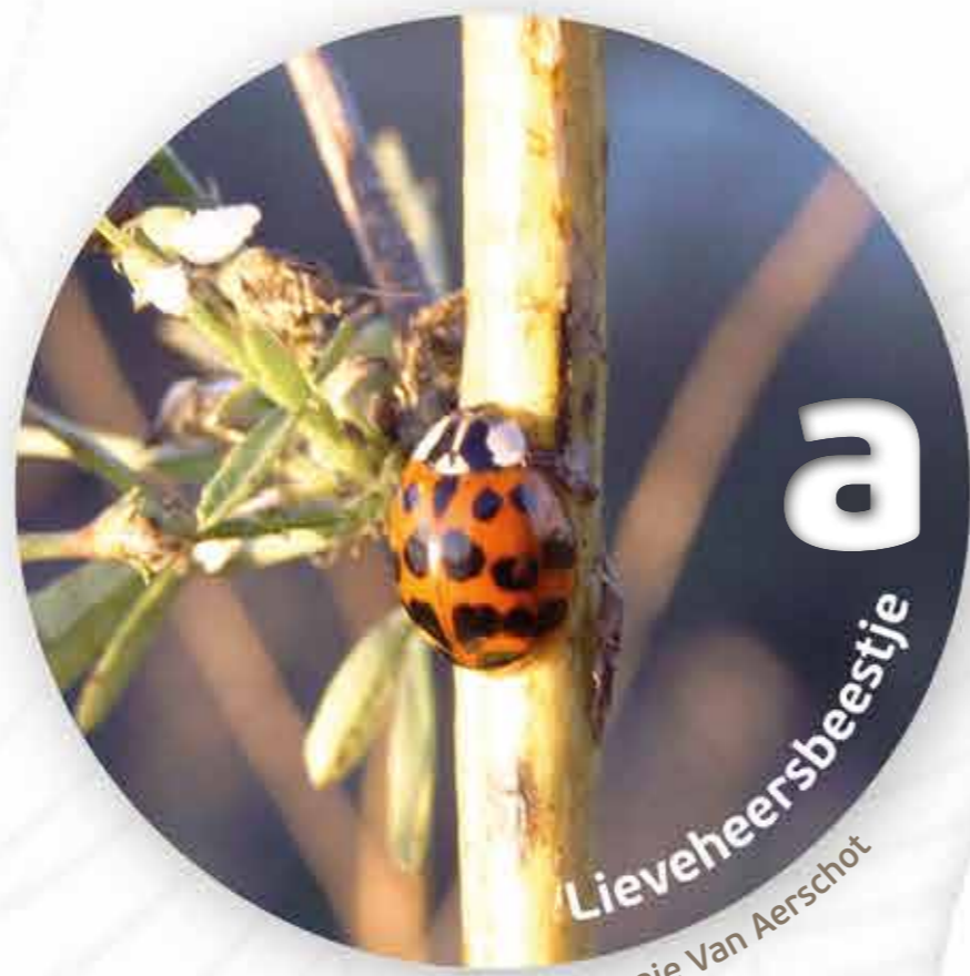
a Lieveheersbeestje

In de winter metsel ik mijn huisje dicht. Misschien denk je dan dat ik dood ben. Maar nee hoor, ik zit gezellig binnen.