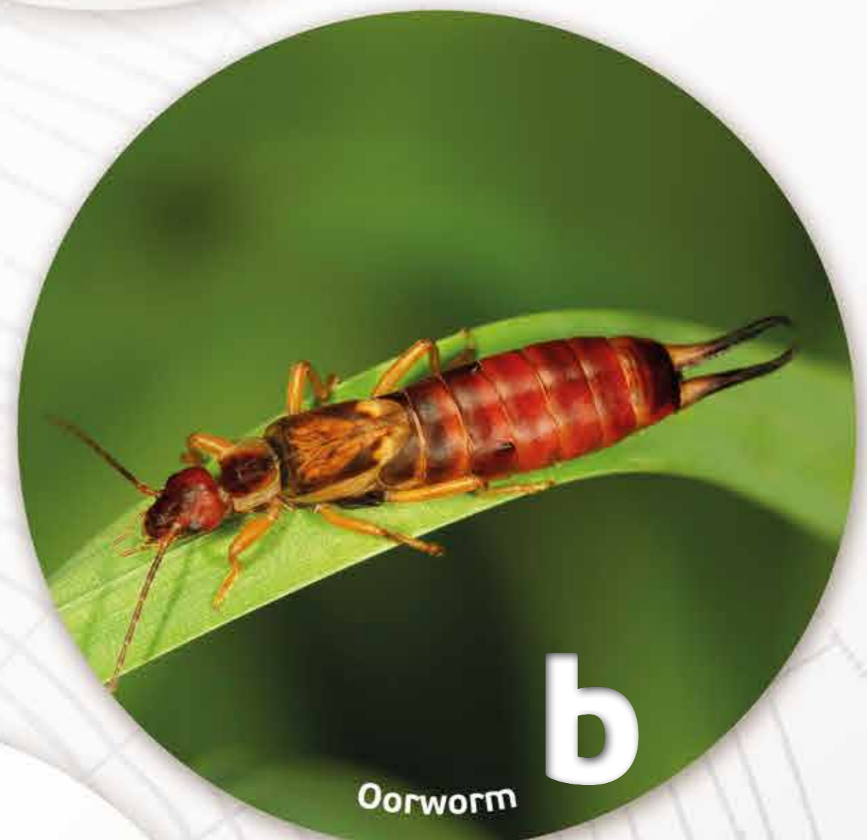
b Oorworm

Ik heb een heel speciale hobby. Bladluizen zijn voor mij een beetje zoals koeien voor een boer. Ik melk ze!