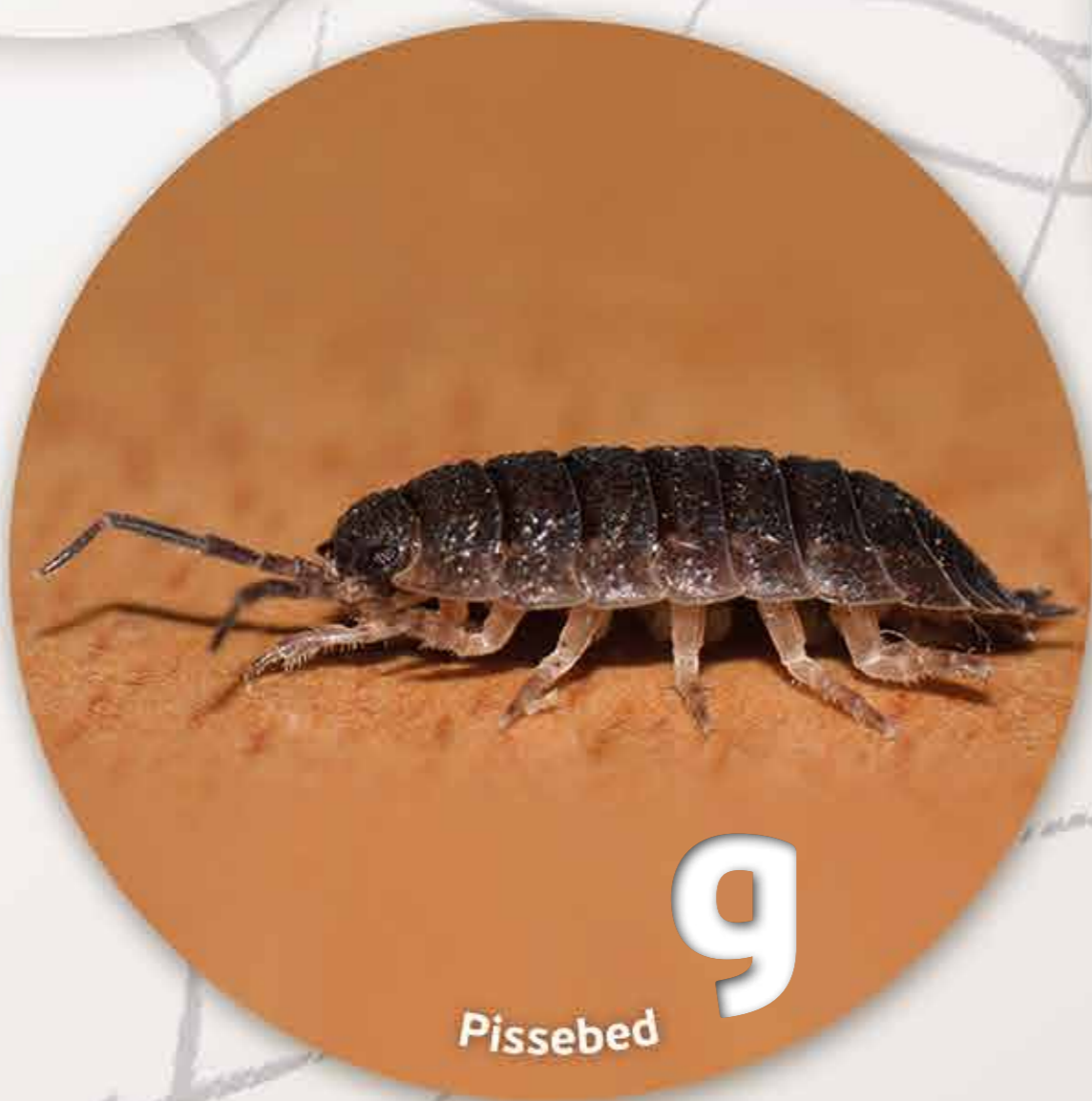
g Pissebed

Je vindt me terug in alle maten, vormen en kleuren. We hebben ook mooie namen afhankelijk van de soort: mierenleeuw, boktor, soldaatje, ... Wat vind je van mijn glimmend schild?