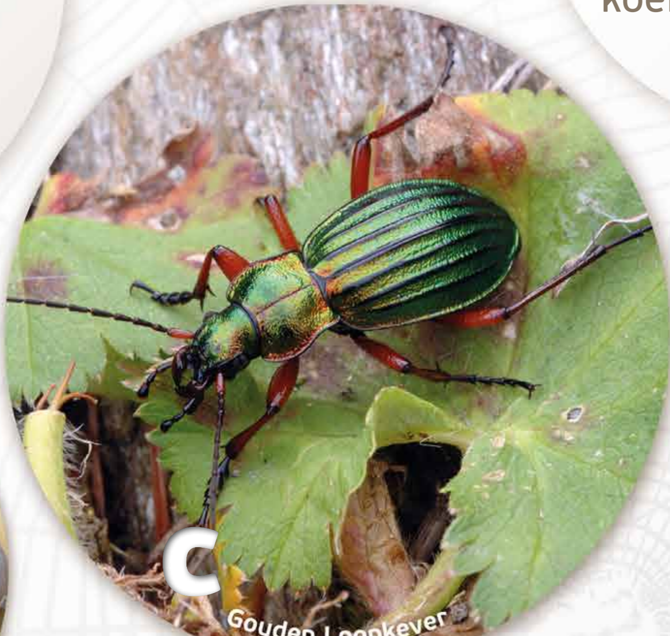
c Gouden Loopkever

Ik ben de acrobaat van alle kriebeldiertjes. Ik tuimel en ik val, ik maak vlieglijnen en soms ga ik op en af als een jojo!