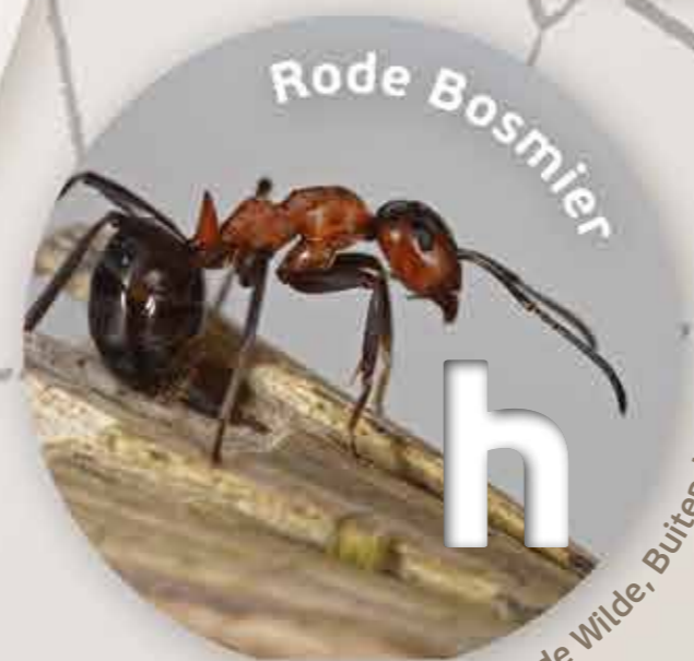
h Rode Bosmier