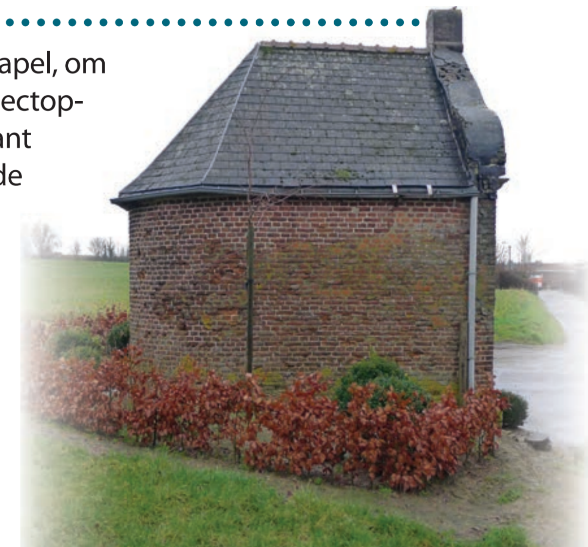
Slechte toestand van de kapel vóór de restauratie (foto 09/02/2016)

De restauratie van de kapel is een initiatief van Regionaal Landschap Zuid-Hageland en de familie Pittomvils-Devadder, in samenwerking met de provincie Vlaams-Brabant (dienst erfgoed), Monumentenwacht Vlaams-Brabant, de Vlaamse Landmaatschappij en de Stad Tienen