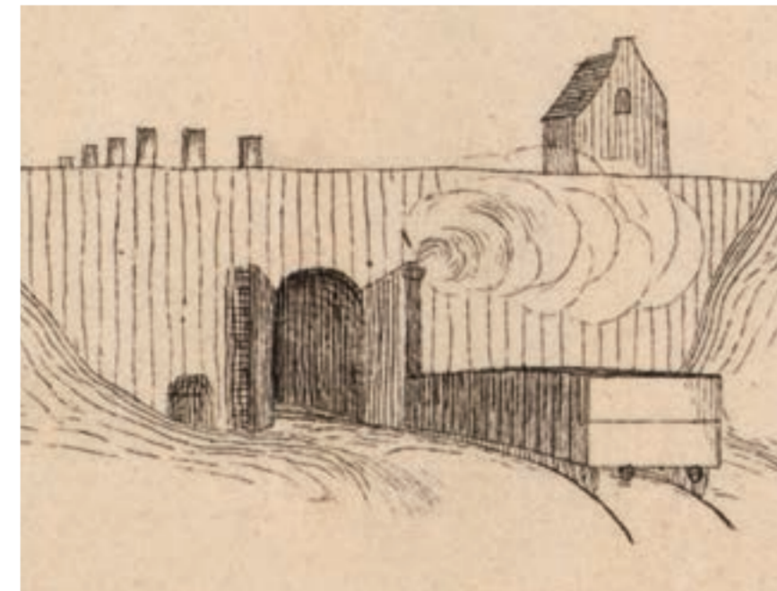
Westelijke ingang van de voormalige tunnel, nabij Medekersveld