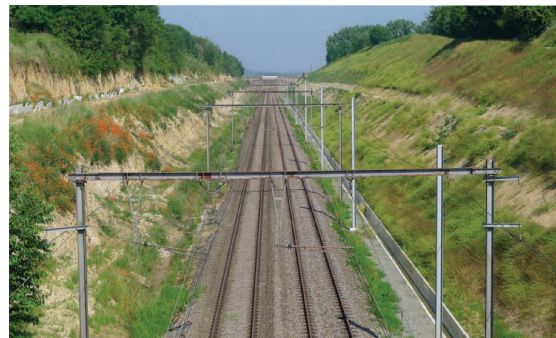
Spoorwegbedding ter hoogte van voormalige tunnel (foto 14/06/2017, vanop brug St-Barbarastraat)

In 1842 startte de bouw van een tweede tunnelkoker. De nieuwe koker was hoger en breder en lag vlak langs de bestaande. De bouw verliep helaas niet zonder slag of stoot. Na meerdere instortingen van het gewelf verliet men het idee van de tunnels. Bovenop de brokstukken van de ingeslagen tunnel legde men 2 sporen aan in open sleuf. De heuvel werd hiervoor afgegraven tot de huidige steile taluds. Naar verluidt droegen Luikse mijnwerkers hierbij de aarde in manden op de rug.