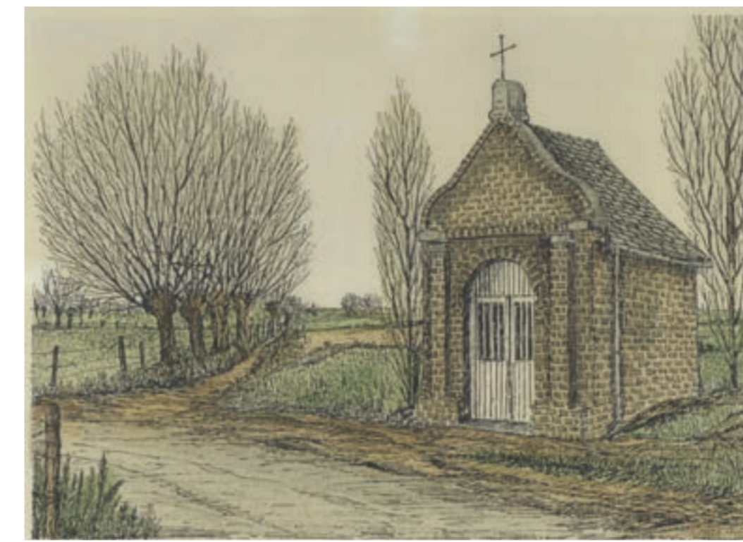
Handgekleurde pentekening uit 1984 (© Pierre Bruyninckx)

De kapel werd gebouwd in 1836-1837 door de arbeiders die ook de tunnel bouwden. Ze werd opgericht ter ere van Sint-Barbara, niet toevallig de patroonheilige van de mijnwerkers en gevaarlijke beroepen. De grond voor de kapel werd ter beschikking gesteld door de familie Tassin, die tot in 2016 eigenaar bleef van de kapel.