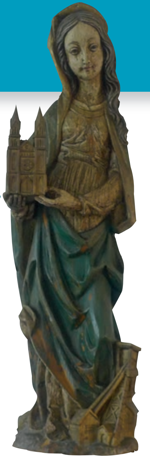
Houten beeld van Sint-Barbara (in de kapel)

De geschiedenis van deze kapel is onlosmakelijk verbonden met die van de voormalige spoorwegtunnel van Kumtich. De bouwers van de tunnel richtten de kapel op, als dank aan St-Barbara voor de bescherming tegen ongelukken.